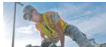
- Anzeigenteil -