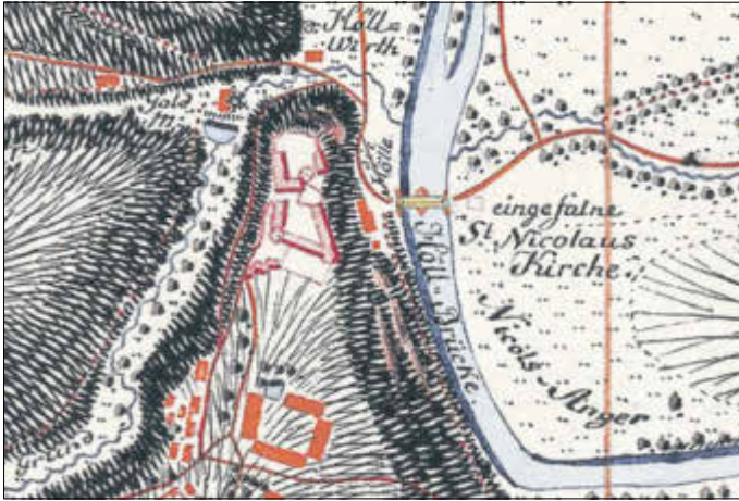
Abbildung 6: Muldenquerung Wiesenburg und Gasthof zur Hölle (Bildmitte). In: Aster, Friedrich Ludwig: Meilenblätter von Sachsen, Blatt 1 bis 180: Berliner Exemplar. Aufgenommen vom Sächsischen Ingenieur-Korps 1780 bis 1806 unter Leitung von Friedrich Ludwig Aster. Maßstab 1:12 000. Eine Karte in 370 Teilen. Mehrfarbig; je Blatt 57 x 57 cm. Mit Höhenschraffen. Nordwesten ist oben. Hier: Auszug aus Blatt 173 (Kirchberg, Saupersdorf, Wiesenburg, Weißbach, Hartmannsdorf).

Seit Jahrhunderten kreuzten sich an einer ehemaligen Furt durch die Zwickauer Mulde Verkehrswege. Zum einen führte links des Flusses die Nord-Süd-Fernverbindung von Zwickau über Silberstraße (vormals Neue Ruh) durch Wiesenburg in Richtung Erzgebirge. Zum anderen bildete die Wildenfels-Auerbacher-Chaussee, wie sie im 19. Jahrhundert hieß, die Ost-West-Magistrale. Zudem trafen sich an der Muldenfurt unterhalb des Schlosses der Kirchensteig, der Haara, Wiesen, Wiesenburg und Schönau verband, und der Narrensteig, der hart am linken Muldenufer Richtung Weißbach verlief. Dort, wo sich alle Straße und Wege trafen, lag die Hölle.