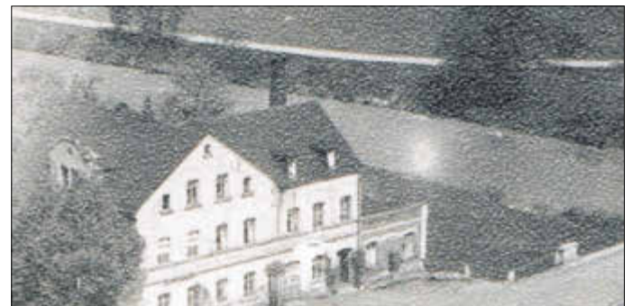
Abbildung 13: Ernst-Schneller-Straße 14 in Wiesenburg. Zapfsäule etwa mittig am unteren Rand sichtbar; rechts unten die Auffahrt auf die Muldenbrücke. Foto aus den 1940er Jahren.

1901 wurde der Flachbau aufgestockt und erneut angebaut. Hermann Arthur Oschatz übernahm die Restauration im Jahre 1914. Unter ihm wurde das nunmehrige Café Oschatz berühmt für hervorragende Konditoreiwaren. Die erste in Wiesenburg bezugte Tankstelle, eine Zapfsäule im Handbetrieb, stand 1931 vor seinem Haus.