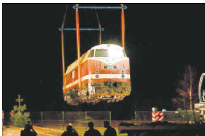
Abbildung 5: Bahnstraße 04 in Wiesenburg. Am 11. April 2018 gegen 23:30 Uhr schwebte die Diesellok 208 in zwei Schlaufen, die zwei Autokräne hielten, vom regulären Gleis (hinten) auf ihren neuen Platz (vorn) als Lokhotel.

In der Nacht vom 11. zum 12. April 2018 hoben ein 130-Tonnen- und ein 80-Tonnen-Autokran gemeinsam die von der Firma Pressnitzalbahn kommende Diesellok vom regulären Gleis Zwickau-Aue auf ihr neues Fundament. Die spektakuläre Aktion, die Dutzende Fotografen und Schaulustige anzog, funktionierte präzise. Nach etwa zwei Stunden angespannter Arbeit der Logistiker stand die Lok auf ihrem neuen Platz.