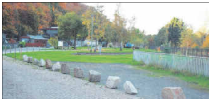
Abbildung 4: Bahnstraße 03 in Wiesenburg, vormaliges Bahnhofsgebäude. Das Fundament (Bildmitte) des Lokhotels ist errichtet.

Nach dem Abriss des Bahnhofs Wiesenburg wurde an derselben Stelle zunächst ein Stück Eisenbahnschiene verlegt, das als „Fundament“ des Lokhotels dient.