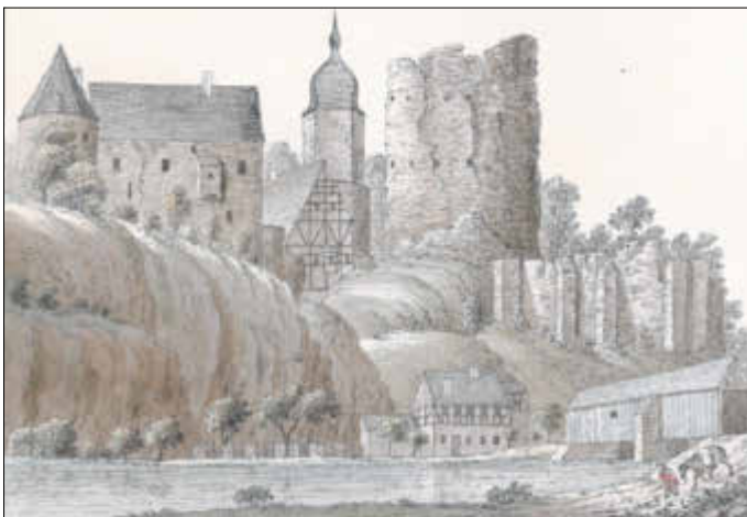
Abbildung 7: Bahnstraße 07 in Wiesenburg, Gasthof zur Hölle (untere Bildmitte), rechts davon die älteste Darstellung der Muldenbrücke Wiesenburg. Aus: Oldendorp, Christian Johannes: Die merkwürdigsten alten Burgen und Schlösser des Königreiches Sachsen. Walthersche Hofbuchhandlung Dresden. Zweite Sammlung, 1812.

Der Gasthof zur Hölle ist die mit Abstand älteste Restauration in Wiesenburg. Sie lag direkt an der Auffahrt auf die rund 50 Meter lange Muldenbrücke, die wohl schon seit dem späten Mittelalter den Fluss überspannte. Das älteste Bild von ihr zeigt eine überdachte und mit Holz verkleidete Konstruktion, die auf steinernen Pfeilern ruhte.