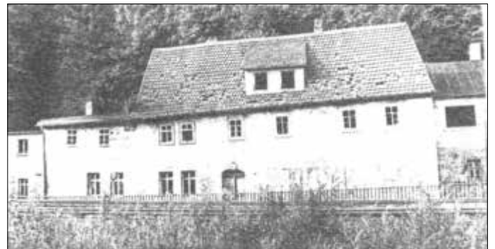
Abbildung 8: Bahnstraße 07 in Wiesenburg, vormaliger Gasthof zur Hölle, abgerissen 1988. Foto aus den 1980er Jahren.