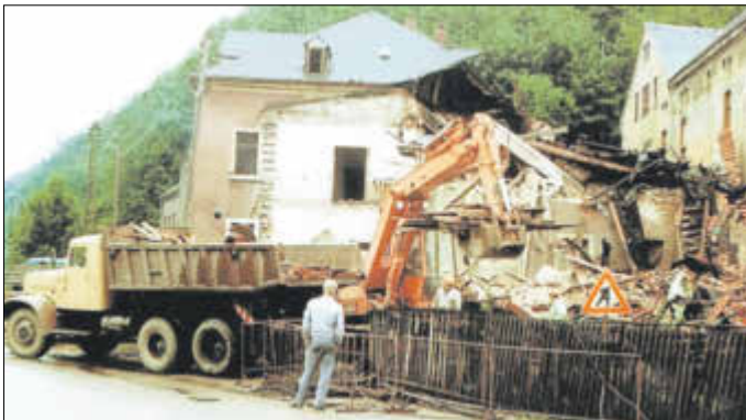
Abbildung 11: vormals Bahnstraße 03 in Wiesenburg. Foto von 1988.