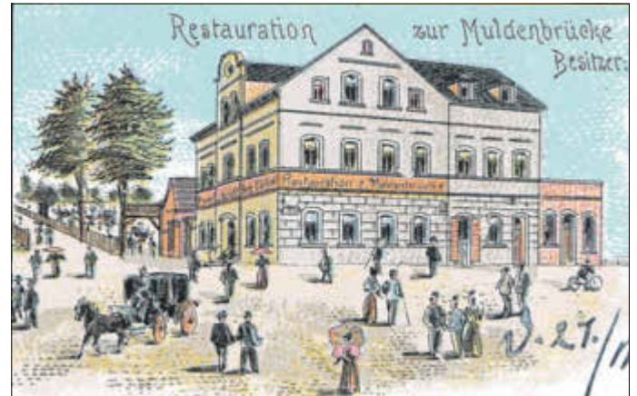
Abbildung 12: Ernst-Schneller-Straße 14 in Wiesenburg. Ausschnitt aus einer am 23. Mai 1902 von Wiesenburg nach Pirna postalisch gelaufenen Ansichtskarte. Anbauten rechts am Haupthaus.