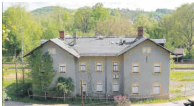
Abbildung 3: Bahnstraße 04, Bahnhof Wiesenburg/Erzgebirge. Bauzustand am 13. Mai 2017.