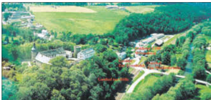
Abbildung 14: Muldenquerung Wiesenburg mit den historischen Gaststätten: Gasthof zur Hölle, Gasthof zur Eisenbahn, Gasthof zur Muldenbrücke sowie – hier noch nicht dargestellt – mit dem aktuellen Lokhotel V180. Luftbild anlässlich der 850-Jahr-Feier Wiesenburgs im Juni 2006.

agentur; Landwarenhaus und Warenlager; Bushaltestelle und Tankstelle.