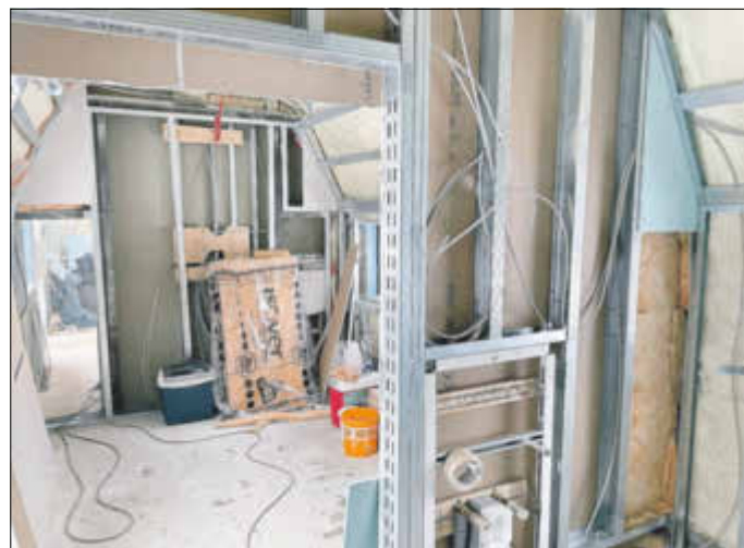
Abbildung 2: Künftiges Lokhotel V 180 in Wiesenburg, Bautenstand im März 2021: Eine Vielzahl von Gewerken vollbringen Maßarbeit am „Einzelstück“ auf engstem Raum.

Am anderen Ende des Fahrzeugs hat das „Familienzimmer“ zusätzlich Raum für ein Kind, das in einer höhlenartigen Schlupfkabine träumen kann. Der mittlere „Dampflokkraum“ wird behindertengerecht ausgebaut. Über einen Scherenhubtisch gelangen auch Rollstuhlfahrer in die barrierefreie Unterkunft mit unterfahrbarem Waschbecken und großflächigem Sanitärbereich.