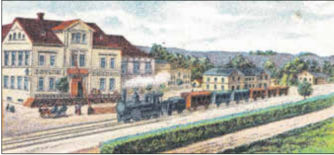
Abbildung 10: vormals Bahnstraße 03 (linkes Gebäude) in Wiesenburg. Ausschnitt aus einer postalisch nicht gelaufenen Ansichtskarte um 1890.