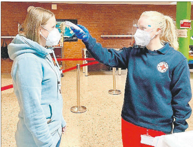
Einlasskontrolle vor der Blutspende mit Temperaturmessung

Vor dem Hintergrund der Corona-Pandemie wird das Infektionsrisiko dadurch so gering wie möglich gehalten - Blutversorgung muss auch über Ostern gesichert sein