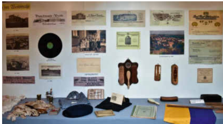
Viele kleine und große Dinge fügten sich zu der Ausstellung zusammen.