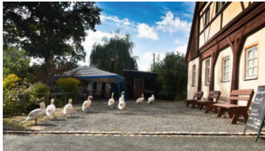
Selbst Familie Schwan schaute vorbei.