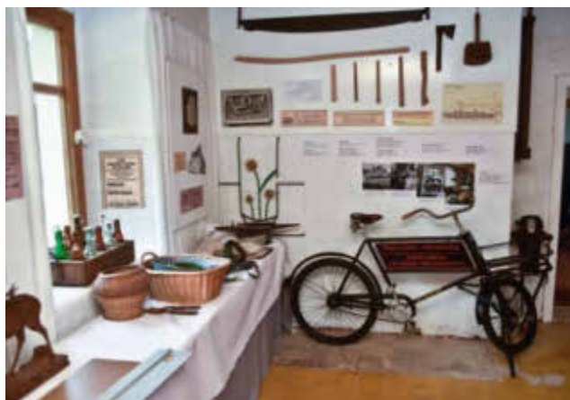
"Firmenfahrzeug" der Isolierfirma Walter Kahlert

Ebenso werden die im Stadtgebiet angebrachten Informationstafeln die Erinnerung über die Ausstellung hinaus daran wachhalten und Interessierte informieren. Weitere Tafeln sind in Arbeit und werden demnächst an entsprechenden Stellen angebracht. Die Informationstafeln gibt es auch in Form von Postkarten und konnten zur Ausstellung erworben werden. Davon wurde reger Gebrauch gemacht. Wegen anhaltender Nachfrage wird eine Neuauflage der Postkarten vorbereitet.