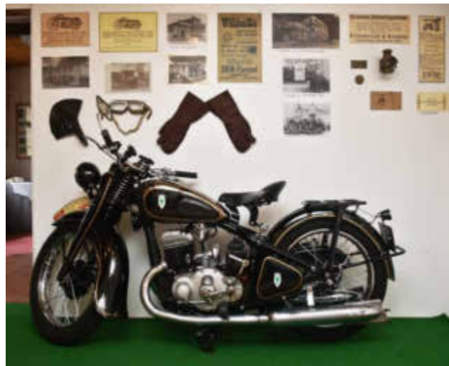
Könnte aus dem Angebot der Firma DKW Pampel stammen.