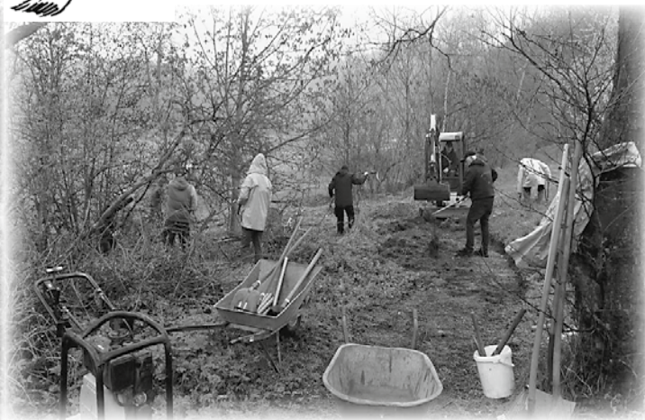
Heimatverein Wiesen e. V.