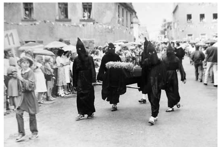
Festumzug 750 Jahre Wildenfels (Bildfolge 11: 1582, 1632, 1641. Die Pest wütet in Wildenfels). Dahinter sieht man noch das alte Meier-Haus, Zwickauer Straße, welches abgerissen wurde.