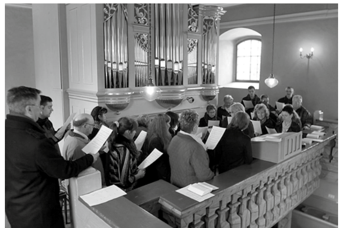
Dienst des Freiwilligen Kirchenchores Härtensdorf zu Karfreitag 2015