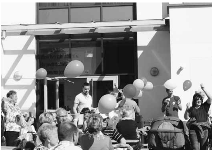
Eindrücke von der Spendenaktion in Wildenfels, organisiert vom Jugendbeirat Wildenfels.