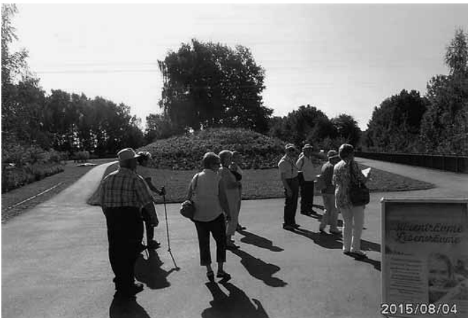
Am Rosenhügel in der Landesgartenschau.