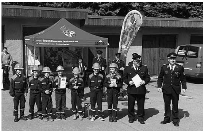
Die Jungen und Mädchen von Wiesenburg (Altersklasse 14 – 18 Jahre) holten sich den 1. Platz und damit den Wanderpokal.

Nachdem alle Mannschaften fertig waren, ging es zur Siegerehrung. Mit den Zeiten landeten die Jungen und Mädchen von Wiesenburg (Altersklasse 10 – 14 Jahre) auf einem spitzenmäßigen 3. Platz.