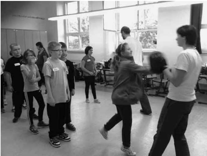
Gewaltprävention und Selbstbehauptungstraining