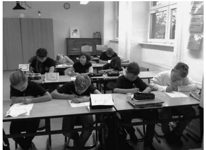
Methodentraining in der Klasse 5 IOR

Im weiteren Verlauf der ersten Schulwoche erhielten unsere Fünftklässler eine Fülle wichtiger Informationen. Sie lernten zum Beispiel, wie man einen Hefter richtig anlegt und führt oder wie man seinen Arbeitsplatz organisiert.