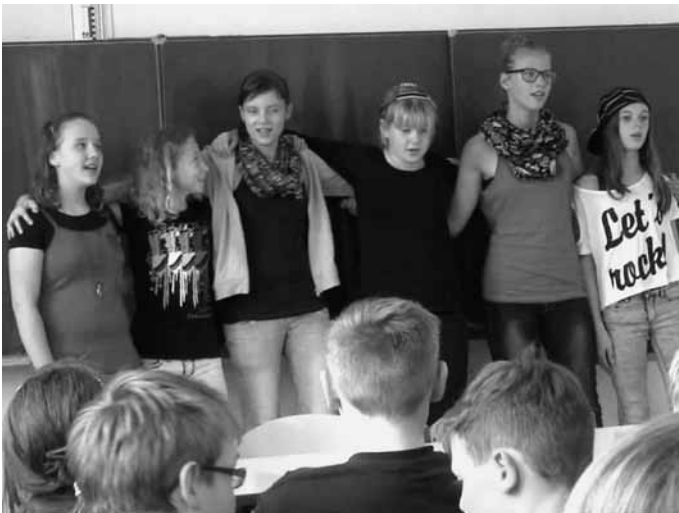
Schauspieler und Sänger der GTA Singewerkstatt