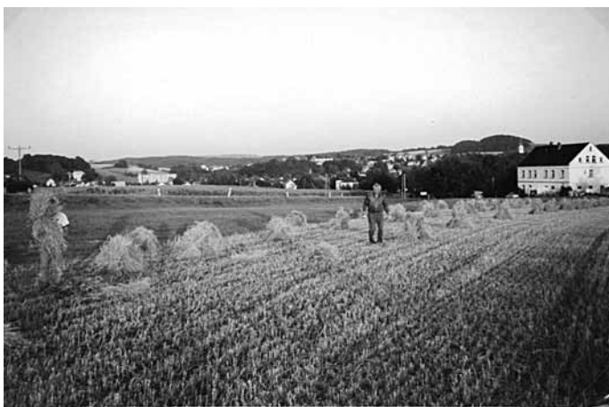
Ein seltener Anblick, ein fast abgeerntetes Feld mit „Getreide-Puppen“.