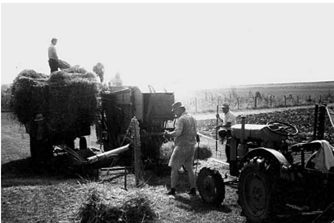
Eine alte Dreschmaschine. Damals und auch heute (siehe Foto) wurde sie zum Dreschen von Getreide genutzt, konnte sowohl mit einer Dampfmaschine als auch mit einem Elektromotor (auch Traktor) angetrieben werden.