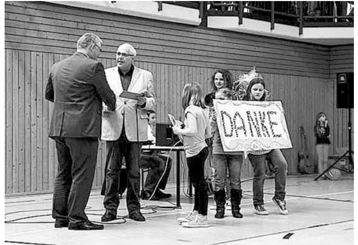
Die Organisatoren des Kinderfestes

Schuster Spedition und Baustoffe, Oelsnitz; Bau-Spezi, Lauter; Schreib- und Spielwaren Müller, Wilkau-Haßlau; Verkehrsverbund Mittelsachsen, Chemnitz; Büroservice Günther, Langenweißbach; Dachdeckermeister Udo Lemnitzer, Hartenstein; Bäckerei Kühnert, Hartenstein; Breedijk Blühender Service, Hartenstein