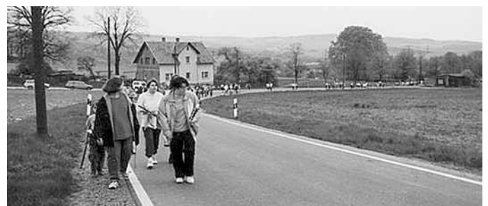
Die Spitze des Schönauer Fackelzuges.

Mit diesem Ziel erwarten wir auch in diesem Jahr wieder viele Gäste am Walpurgisfeuer.