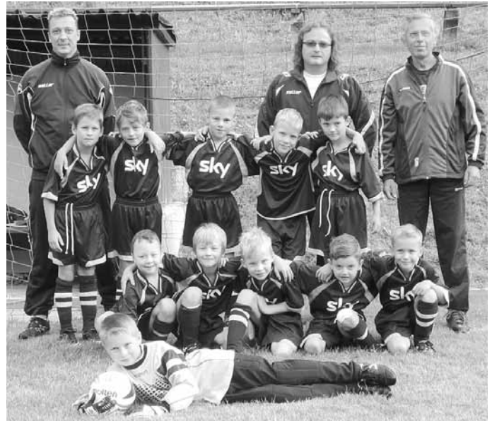
F-Jugend des VfL Wildenfels.