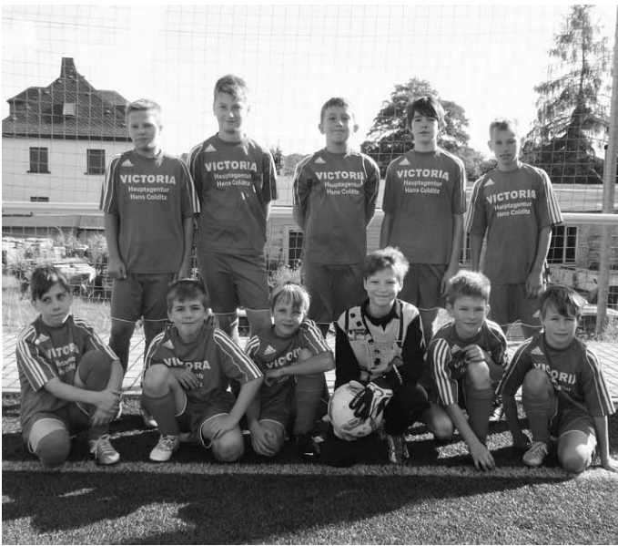
D-Jugend der SG Thierfeld/Wildenfels.