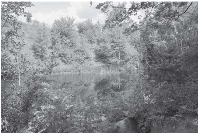
Herrschaftlicher Bruch

Im Jahre 2000 erfolgte schließlich der Widerruf der Bewilligung und 2010 die Einstellung des Verfahrens durch das Oberbergamt Freiberg. Die im Verlaufe dieses Zeitraumes erstellten Gutachten belegten dabei erneut die hohe ökologische und naturschutzfachliche Bedeutung des Gebietes um die Kalksteinbrüche.