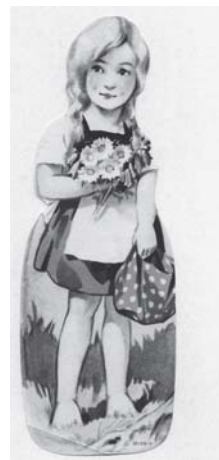
Hänsel und Gretel