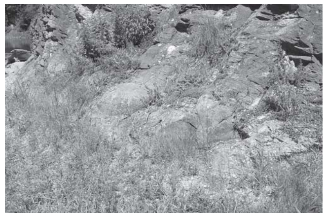
Basophiler Pionierrasen

Das FFH-Gebiet „Kalkbrüche im Wildenfesler Zwischengebirge“ ist eines von 270 derartigen Schutzgebieten in Sachsen und umfasst fünf kleinflächige Teilareale um die Altbrüche und ihr näheres Umfeld mit einer Gesamtfläche von etwa 14 Hektar. Die wertbestimmenden Lebensraumtypen sind dabei neben den Bruchgewässern im natürlichen und naturnahen Grünland zu suchen. Hierzu gehören vor allem die kalkgebundenen Lebensraumtypen mit ihren hier speziellen Ausprägungen. Auf mageren, felsigen und trocken-warmen Rändern der Brüche sind dies kleinflächige Ausbildungen von „Basophilen Pionierrasen“ (LRT 6110) und „Kalk-Trockenrasen“ (LRT 6210), die sich als lückige, niedrigwüchsige Pflanzengesellschaften auf basisch verwitternden Kalkschuttböden entwickeln. Auf den offen zugate tretenden und gut besonnten Felsbändern kommt es in Klüften und auf Felsbänken zur Ausbildung von „Felspaltvegetation auf Kalkfels“ (LRT 8210). In den Bereichen um und zwischen den Altbrüchen kommt es hingegen bei entsprechend stärkerer Humusaufgabe und mäßiger Mähnutzung zur Ausbildung „Magerer Flachland-Mähwiesen“ (LRT 6510), traditionell ein- bis zweischüriger Mähwiesen mit Heuwerbung nach der Hauptblütezeit der Gräser.