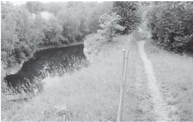
Kalk-Trockenrasen (Quelle: FFH-Managementplan)

Darüber hinaus sind die Marmorbruchhöhle als Winterquartier der FFH-Art Mopsfledermaus und einige Bruchgewässer als Laichhabitats der FFH-Art Kammolch von besonderer Bedeutung. An den trocken-warmen Säumen besitzt auch die Zauneidechse als FFH-Art bemerkenswerte Vorkommen.